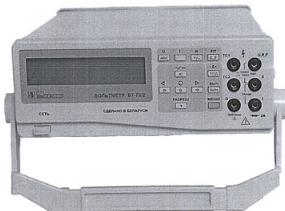
Рисунок 1 – Внешний вид вольтметров